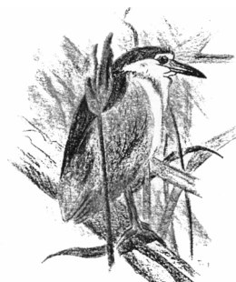
Dessin : M JAY

6 indices de nidification probable : (indice de nidification 2 sur la fiche COGard)