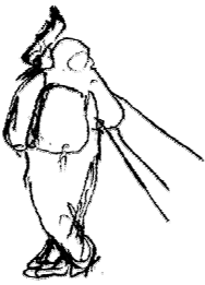
Dessin : M JAY